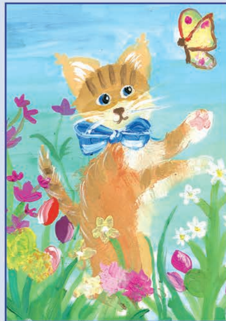
Орлова Виолетта. 9 лет Дачные игрушки для Кэтси