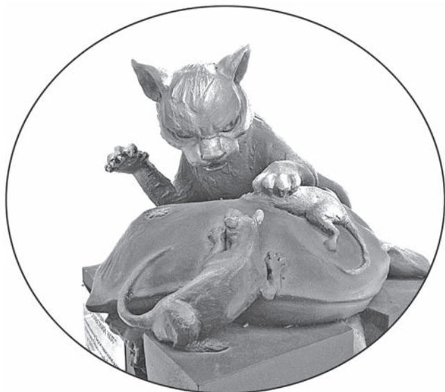
Скульптура «Ярославский кот» Скульптор А.Н. Коришонов. 2015 г. Музей Ярославского зоопарка