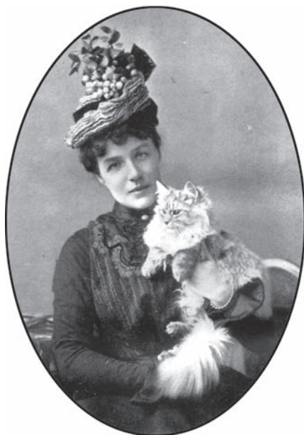
Надежда Лохвицкая (Тэффи) с любимой кошкой. Фото конца XIX – начала XX в.