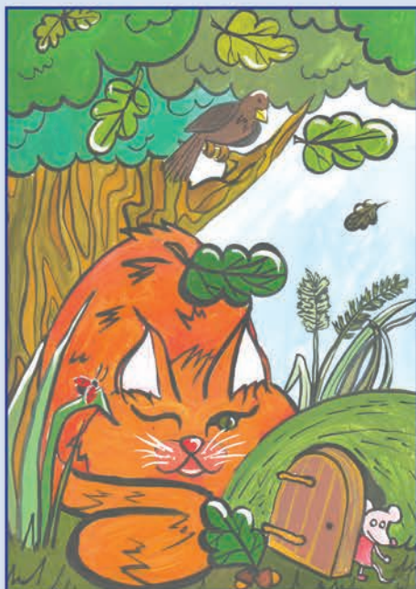
Гизатуллина Ксения. 14 лет Хитрюга