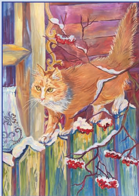
Пилюгина Дарья. 13 лет Кот в снегах